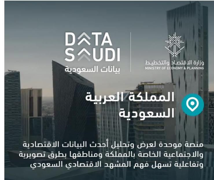
منصة بيانات السعودية